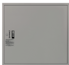
BLACHA STALOWA OCYNKOWANA