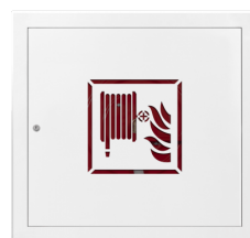
DOWOLNY WZÓR WYCINANY LASEROWO

Blacha nierdzewna gat. 304 szlif 240 lub 316L. W