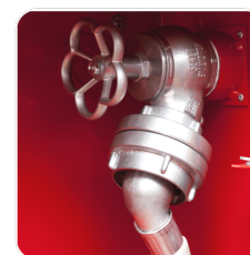
ZAWÓR 52 Z REDUKCJĄ SKOŚNĄ

Hydrant można podłączyć do sieci zasilającej DN50 poprzez zastosowanie zaworu 52 z redukcją skośną Supron 3