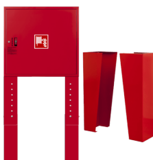
PODSTAWY / PODPORY