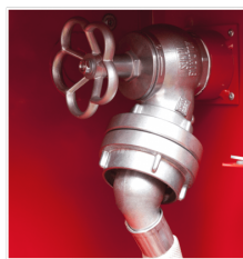
ZAWÓR 52 Z REDUKCJĄ SKOŚNĄ

Hydrant można podłączyć do sieci zasilającej DN50 poprzez zastosowanie zaworu 52 z redukcją skośną Supron 3