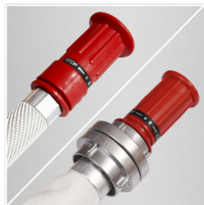
POŁĄCZENIE PRĄDOWNICY Z WĘZEM