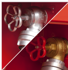
ZAWÓR HYDRANTOWY 52